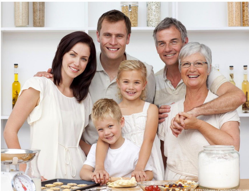
Implantate sind ab 18 Jahren bis in's hohe Alter möglich. Sie geben Sicherheit beim Reden und Lachen und sie ermöglichen es, wie mit eigenen Zähnen zu beißen und zu kauen.

Wenn die Nachbarzähne schon sehr stark gefüllt oder geschädigt sind, kann es besser sein, eine Brücke zu machen. Durch die Kronen werden die Zähne stabilisiert, so dass sie länger halten können.