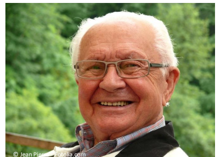
Implantate ersetzen fehlende Zähne fest und komfortabel. Sie haben eine hohe Erfolgsquote und lange Haltbarkeit.

Auch aus diesem Grund entscheiden sich immer mehr Patienten für diese bewährte Art des Zahnersatzes.