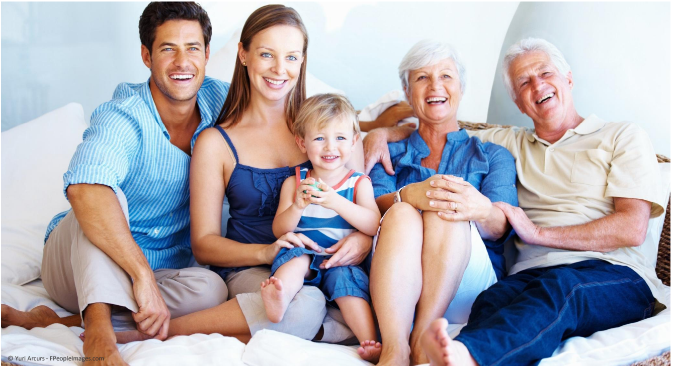
So macht das Leben wieder richtig Spaß: Mit komplett festsitzenden Zähnen essen, reden, lachen und sich im Kreis der Familie wohlfühlen.

Wie Sie wieder komplett fest sitzende Zähne statt Totalprothesen haben können