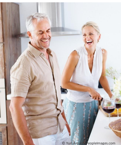
Mit fest sitzenden Zähnen kann man sich wieder jünger fühlen und das Leben aktiver genießen.

Wenn Ihnen schlecht sitzende Prothesen das Leben schwer machen: