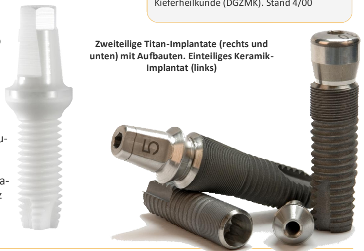
Zweiteilige Titan-Implantate (rechts und unten) mit Aufbauten. Einteiliges Keramik-Implantat (links)

Quelle: Stellungnahme der Deutschen Gesellschaft für Zahn-, Mund- und Kieferheilkunde (DGZMK). Stand 4/00